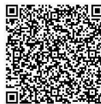
高校生等みらい応援