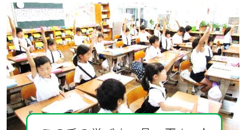
この手の挙げ方、見て下さい！

7月19日（火）は1学期の終業式です。子どもたちは楽しい夏休みに向けて期待でいっぱいです。平成28年度の1学期は、6年生の「加美小学校の新しい歴史を創ります。」という堂々とした決意表明から始まりました。1年生は日々の学習の中で、すっかり元気のよい加美っ子になりました。2年生は町探検を、3年生は学区探検やグリーンカーテンづくり、4年生はクリーンセンターや浄水場の見学、川学習、5年生は渋川海事研修、6年生は奈良・京都への修学旅行と、どの学年も、日々の学習とともに、それぞれの活動や行事に意欲的に取り組みました。また、5、6年生は総合的な学習の時間に「日本の伝統文化を学ぶ」授業が始まっています。尺八、三味線、日本舞踊、剣道、獅子舞とどれも難しい学習ですが、真剣に一から学んでいます。11月の発表会がとっても楽しみです。