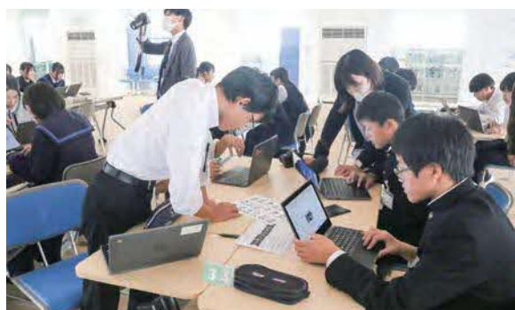
▲メディアリテラシーを学ぶ謎解きゲーム「レイのブログ」を体験する生徒