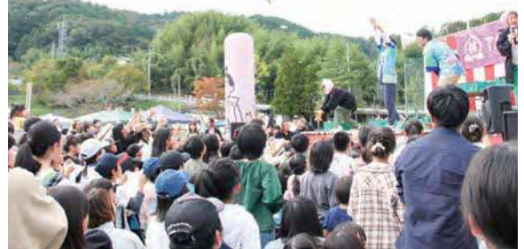
▲お楽しみイベント「キッズお菓子投げ」

中央運動公園野球場で開かれたイベントには、キッチンカーやハンドメイド雑貨、ワークショップなど70店舗以上が集まりました。約4千人が会場を訪れ、ダンスや紙芝居、ヒーローショー、「キッズお菓子投げ」「きびだんご投げ（福くじ付きもち投げ）」などのステージイベントで盛り上がりしました。（同実行委員会主催・10月26日）