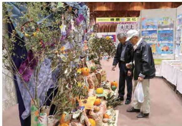
▲柵原東保育園の作品を鑑賞(柵原)