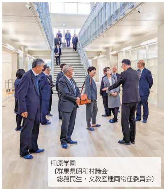
柵原学園 〔群馬県昭和村議会 総務民生・文教産建両常任委員会〕

美咲町としてもお越しになる方々との情報交換や交流を、これからのまちづくりに生かしていきたいと考えています。