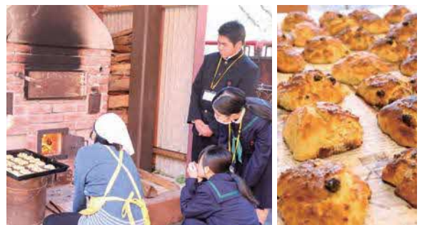
▲子どもたちに見守られ最後の仕事。焼き上がりは、外はサクッと中はしっとり、ほどよい甘さの栄養パン

旭地域多世代交流拠点の整備に伴い、解体が決まっている旭町民センターで生涯学習講座「栄養パンを作ろう！」が開催され、13人が参加しました。講師は栄養委員。役場へ職場体験に来ていた中央中2年生3人も参加し、地元の方と一緒にパン作りを体験しました。栄養パンは栄養委員さんが一人暮らしの高齢者に年に1回配付しています。（11月8日）