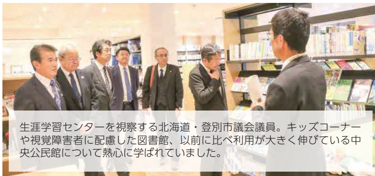
生涯学習センターを視察する北海道・登別市議会議員。キッズコーナーや視覚障害者に配慮した図書館、以前に比べ利用が大きく伸びている中央公民館について熱心に学ばれていました。