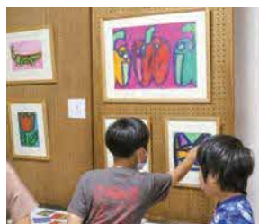
◀あなぐま舎 まつもとりおさん の作品(旭)