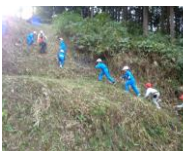
【保育園・1年】里山の秋探し