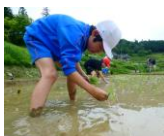
【5年】棚田で米づくり・大阪岬町との交流