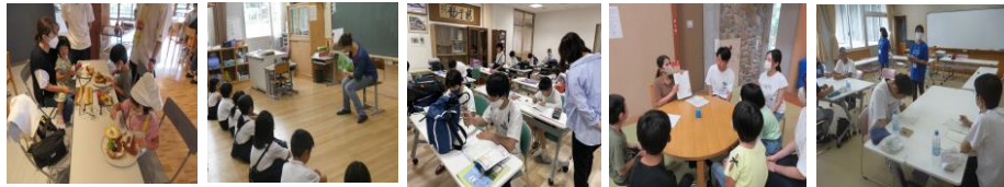
のびのびサタデー 学校協働ボランティア 寺子屋あさひ 国際交流キャンプ 親育ち応援学習プログラム