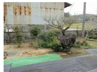
中央No72 外観・外回り