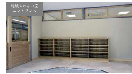
▲ 増築・校舎棟 1F