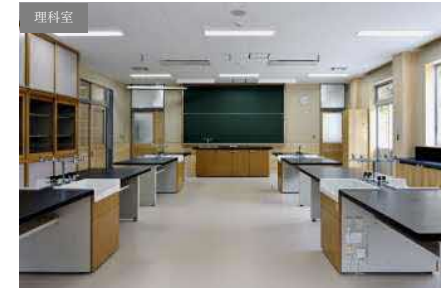
▲ 増築・校舎棟 2F