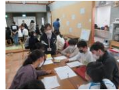
イングリッシュキャンプ