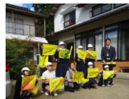
【6年】小規模多機能自治