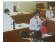
【9年】子ども議会で提案