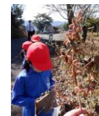
【保育園・1・2年】秋採し