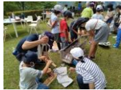
のびのびサタデー