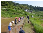
【5年】棚田で米づくり