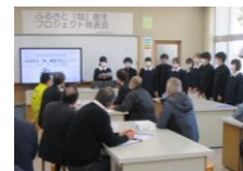
【8年】プロジェクト発表会