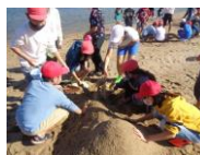
【5年】大阪岬町との交流