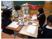
学校協働ボランティア