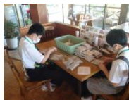
【8年】地域での職場体験