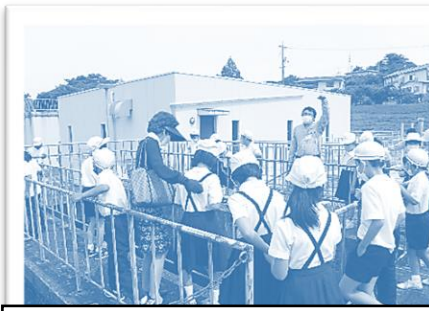
4年生 浄水場・クリーンセンター見学