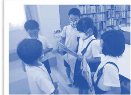
学校探検で1年生を案内する2年生 ・2年生にお礼のお楽しみ会をする1年生