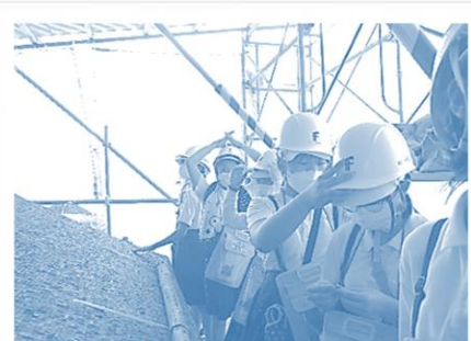
6年生 本山寺修復を見学