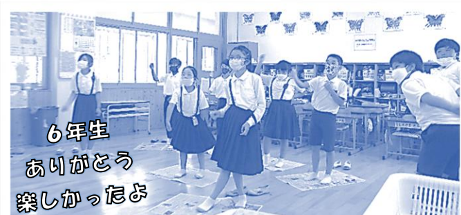
6年生 ありがとう 楽しかったね