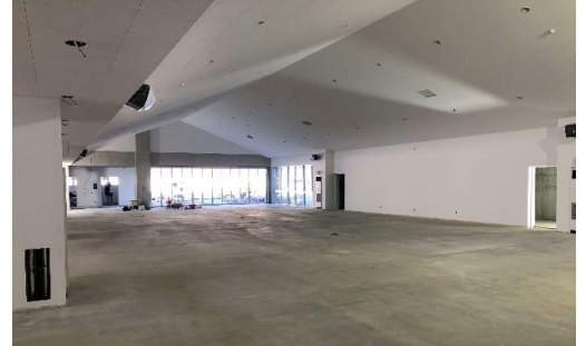
校舎内部の様子（交流ホール）

建築工事は順調に進んでおり、年内に約70%完成し、3月上旬に完了する見込みです。12月からは外構工事も始まっています。備品については、各学校で引き続き使用できるもの、新規購入が必要なものの仕分け作業を行っており、開校に向けた準備を行っています。