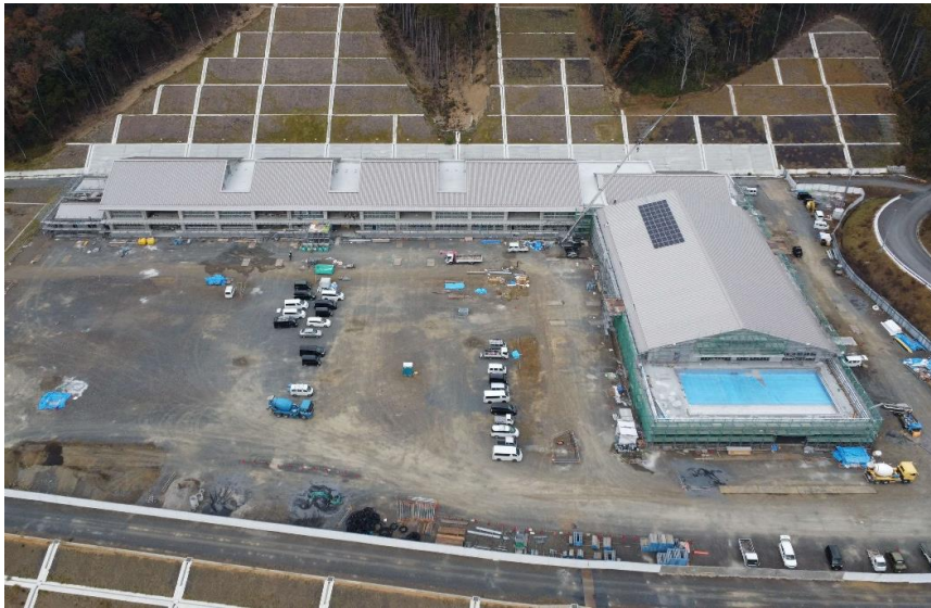
建築工事の状況（R5.11末現在）

建築工事は順調に進んでおり、年内に約70%完成し、3月上旬に完了する見込みです。12月からは外構工事も始まっています。備品については、各学校で引き続き使用できるもの、新規購入が必要なものの仕分け作業を行っており、開校に向けた準備を行っています。