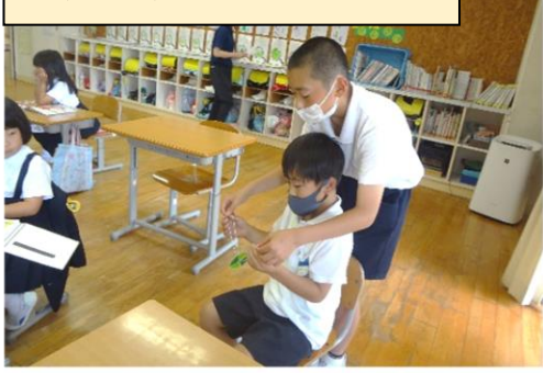
びゅんびゅんごまのプレゼント