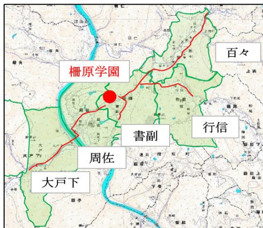
徒歩通学路（小学校課程）