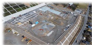
令和5年3月下旬現在