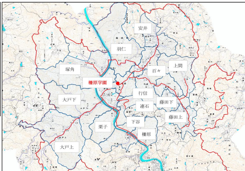
自転車通学路（中学校課程）

※ スクールバス運行ルート・停留所を含めた詳細は、下の二次元コードから開校準備委員会のHPをご覧ください。